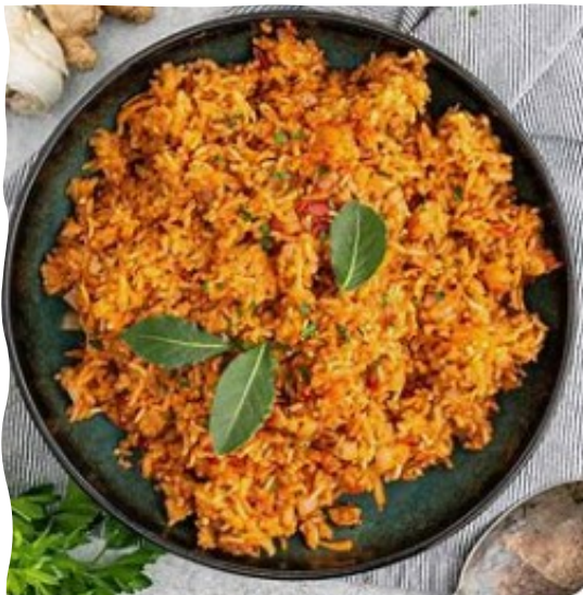
Yollof Reis, nigeranisches (National)gericht