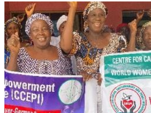
Beide Fotos zeigen Begünstigte von CCEPI

Antragssumme/Laufzeit: 49.000€ für 2 Jahre (01.2026-12.2027)