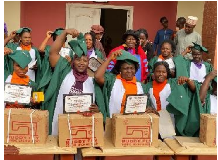
Frauen haben erfolgreich die Ausbildung im Nähen abgeschlossen