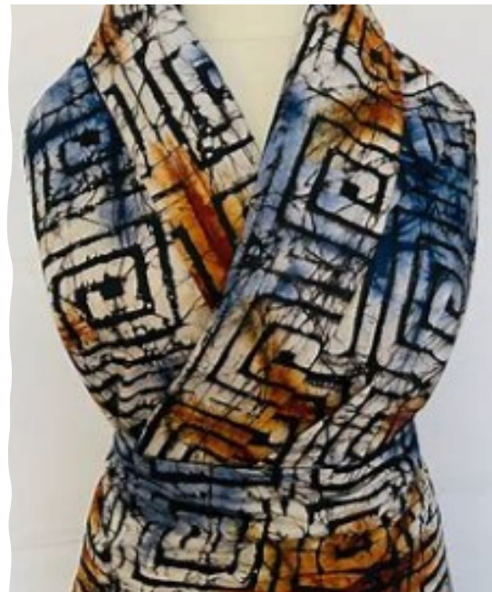
Adire, Stoff der Yoruba