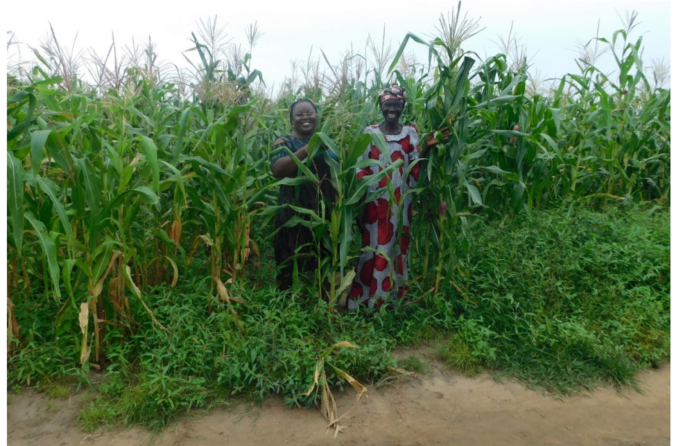
Landwirtinnen vor ihrem Feld