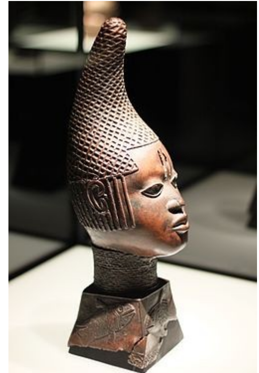
Bronze-Kopf der Königinmutter Idia, frühes 16. Jahrhundert. Ethnologisches Museum , Berlin.