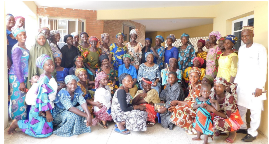
Gruppe der Begünstigten

Antragssumme/Laufzeit: 30.000€ für 2 Jahre (01.2025-12.2026)